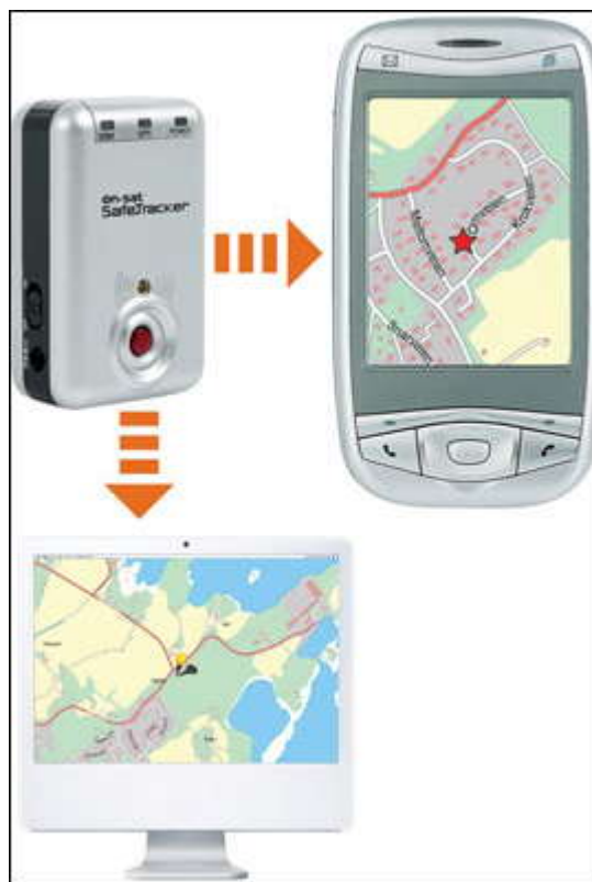
KARTINFO: Når båten flyttes får du SMS med link til kart og posisjon, i tillegg til at du kan spore på nett.

Innholdet i utskriften er vernet etter åndsverklovens regler. Utskriften er kun til privat bruk og kan ikke benyttes på annen måte. Kopiering eller spredning av innholdet krever avtale med rettighetshaver eller Kopinor.